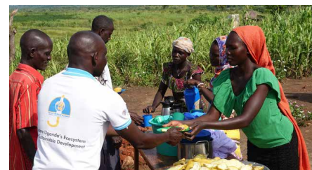
La MAF a effectué le transport de plusieurs membres d'une organisation partenaire vers le nord de l'Ouganda, pour secourir des personnes bloquées dans le camp de réfugiés de Rhino.

Tanzanie : Les safaris médicaux sont organisés en Tanzanie depuis 60 ans déjà. Grâce à ces cliniques mobiles, les habitants des zones reculées reçoivent des soins médicaux.