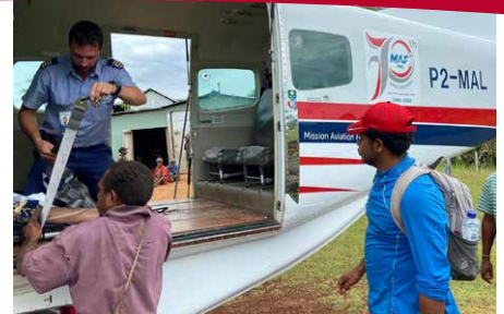
Le vol a été la deuxième étape importante du transport des jumeaux.