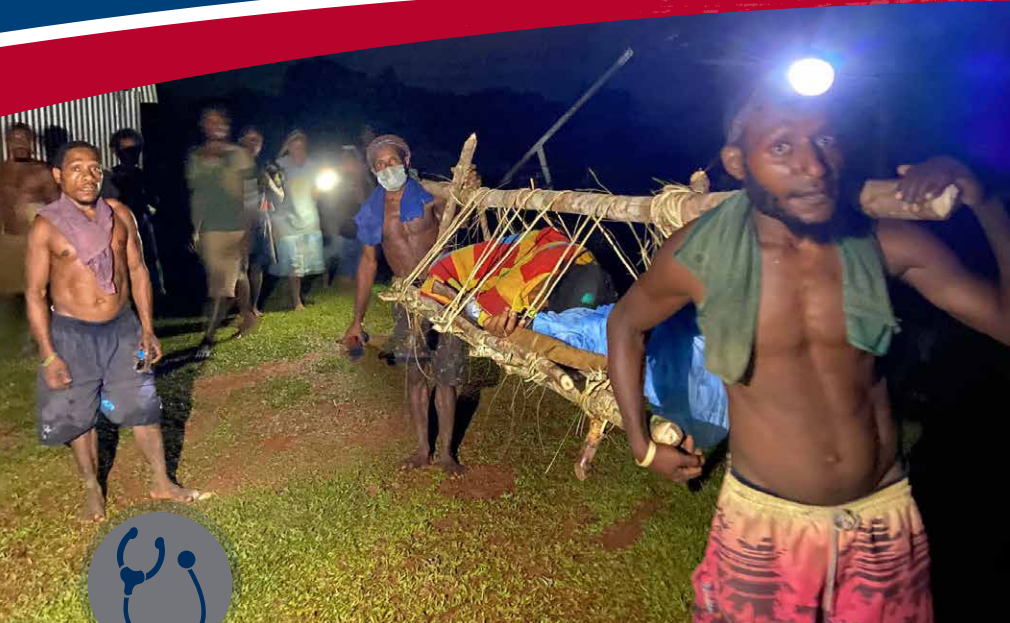
De vrais héros : Le transport a duré cinq heures à travers les fourrés et la brousse.