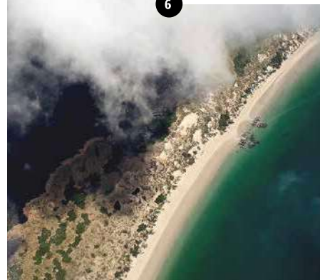
10:30 Uhr _Über den Wolken. Die Luft ist frisch und klar, die Wolken (noch) weiß und das Meer herrlich türkisblau.