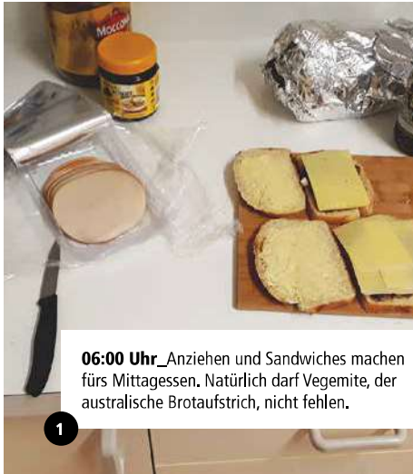
06:00 Uhr _Anziehen und Sandwiches machen fürs Mittagessen. Natürlich darf Vegemite, der australische Brotaufstrich, nicht fehlen.