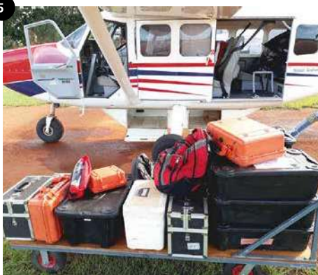
08:35 Uhr _Meine ersten Passagiere treffen ein: Zwei Ärzte, welche nach Baniyala fliegen, um die erkrankten Einwohner in diesem Homeland zu untersuchen. Mit dabei: einen ganzen Trolley mit Kisten, Boxen, Taschen. Die große Frage: Passt das alles in das Flugzeug?