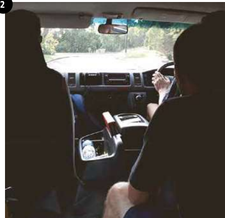
06:45 Uhr _Im Kleinbus zum Flughafen. Oft Ort für lustige Diskussionen, wer jetzt noch wo abgeholt werden muss oder eben auch nicht ...