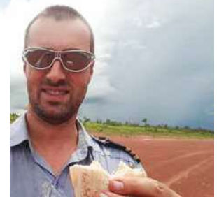
14:20 Uhr _Die Piste in Mirratja liegt mitten in einem Wolkenloch. Sie ist für mein Flugzeug eher kurz (760 m) und mit 2 % auch die am stärksten geneigte Landebahn. Zeit für ein kurzes Mittagessen. Bibbernd denke ich an den Rückflug, dessen Route scheinbar mitten durch die Gewitter führt ...